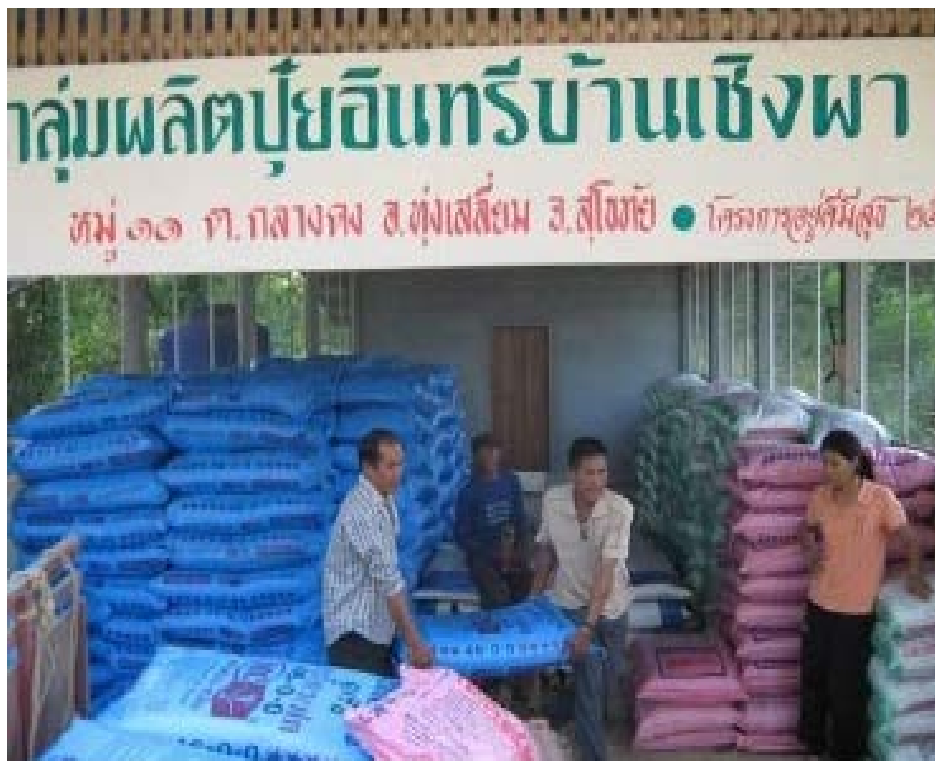
กิจกรรมกลุ่มผลิตปุ๋ยอินทรีย์