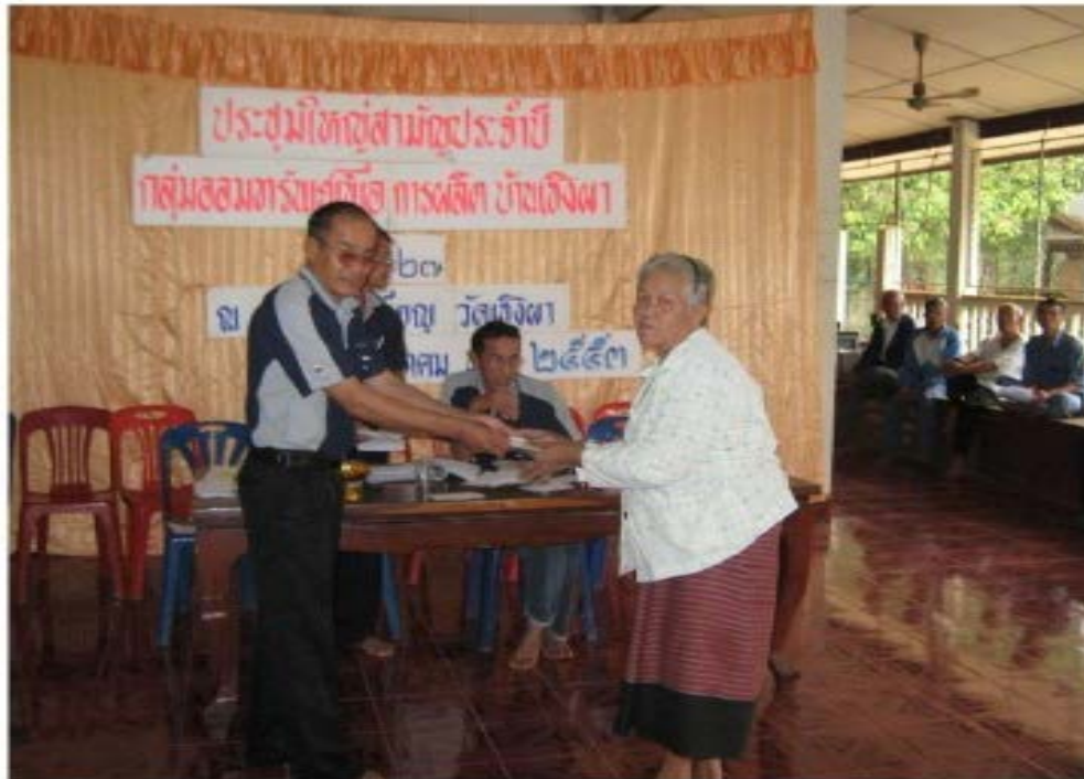
จัดสวัสดิการผู้สูงอายุ

กลุ่มออมทรัพย์เพื่อการผลิตบ้านเชิงผา หมู่ 11 ตำบลกลางดง อำเภอทุ่งเสลี่ยม จังหวัดสุโขทัย