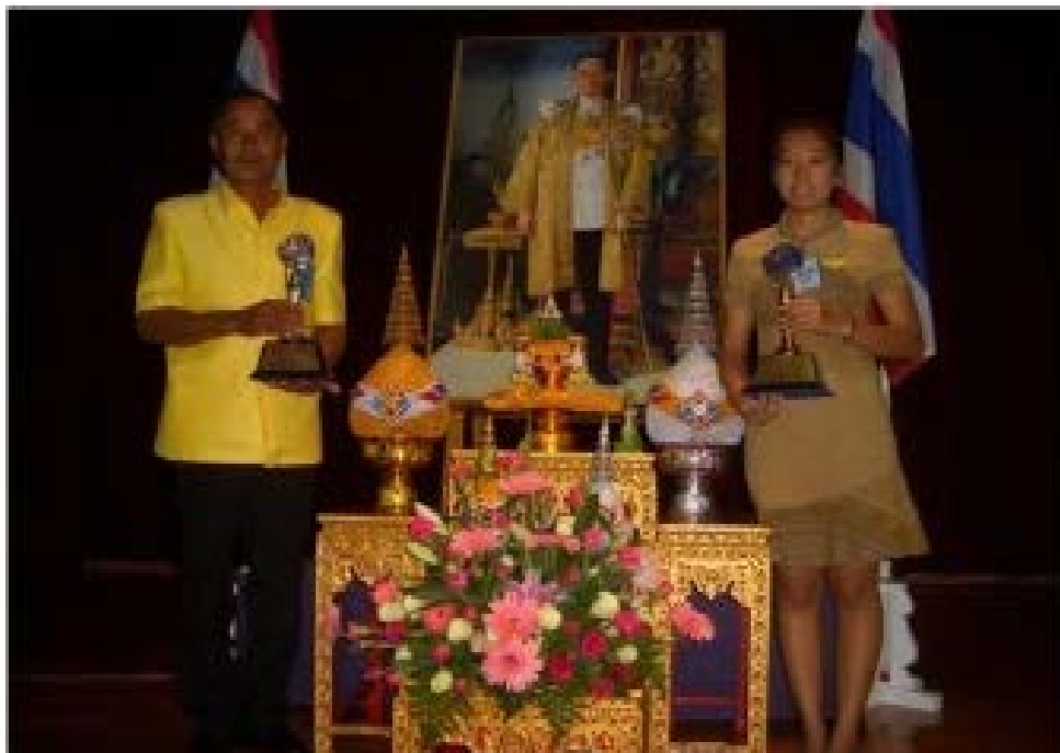
รับรางวัลกลุ่มออมทรัพย์เพื่อการผลิตดีเด่น