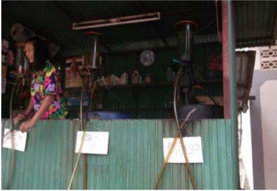
กิจกรรมป้มน้ำมัน

กลุ่มออมทรัพย์เพื่อการผลิตบ้านเชิงผา หมู่ 11 ตำบลกลางดง อำเภอทุ่งเสลี่ยม จังหวัดสุโขทัย