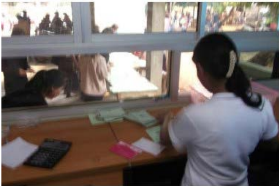
กิจกรรมการฝากสัจจะ