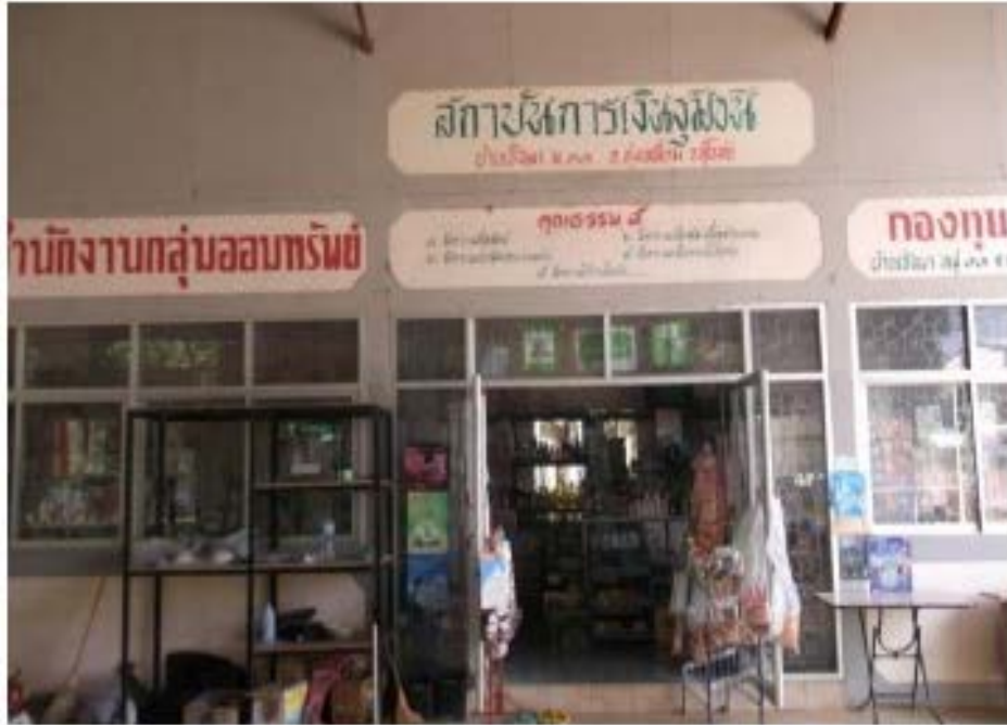
กิจกรรมศูนย์สาธิตการตลาด

กลุ่มออมทรัพย์เพื่อการผลิตบ้านเชิงผา หมู่ ๑๑ ตำบลกลางดง อำเภอทุ่งเสลี่ยม จังหวัดสุโขทัย